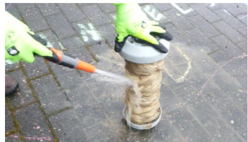
Abb. 7: Spülen der Membranfasern

Die Hohlfasern liegen nun frei und können mit einem scharfen Wasserstrahl von außen abgespült werden.