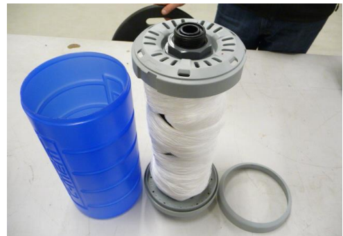
Abb. 6: Geöffnete Membran

In Stellung OPEN kann der Außenring abgenommen werden. Dann kann der blaue Außenmantel nach oben abgezogen werden.