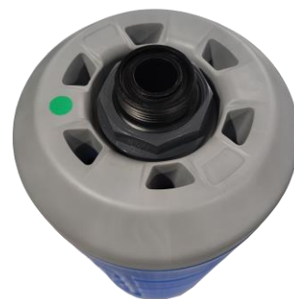
Abb. 3: Membranunterseite (Belüftungsanschluss)