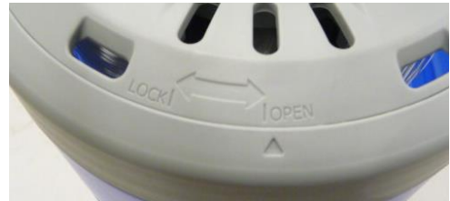
Abb. 5: Außenring mit Pfeilmarkierung auf Stellung OPEN

Zum Öffnen der Kartusche ist der Außenring von der Stellung LOCK in die Stellung OPEN zu drehen (entgegen Uhrzeigersinn). Dabei muss die graue Membranunterseite gegengehalten werden.