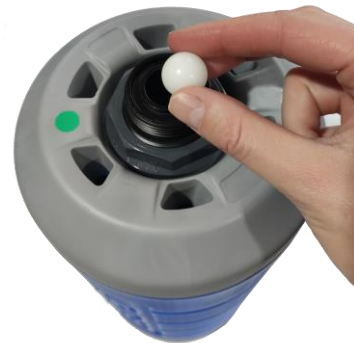
Fig. 4: Kugel für Belüftungsregulierung

Bei Membrankartuschen bis 12'2021 war die Kugel nicht Bestandteil. Bei Austausch einer Membrane mit Kugel, müssen die anderen Membranen der Stationen mit einer Kugel nachgerüstet werden!