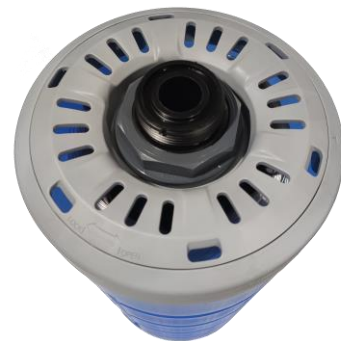
Abb. 2: Membranoberseite mit Drehverschluss (Permeatanschluss)

Die Membrananschlüsse sind mit einer O-Ring-Nut ausgestattet, in die der O-Ring eingelegt wird.